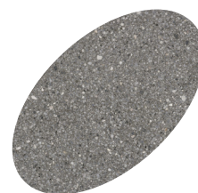
L06 - 330