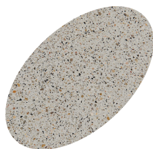
L14 - 330