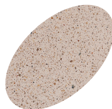
L31 - 330