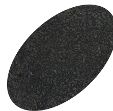
L40 - 330

* Les couleurs figurant dans ce nuancier sont présentées à titre purement indicatif. Cette représentation est la plus proche possible de la réalité, mais ne garantit pas le résultat final lors de l'application. Il est donc recommandé de procéder systématiquement à un échantillonnage suivi d'une validation de la couleur avec le client final, dans les conditions du chantier, préalablement à toute mise en œuvre définitive.