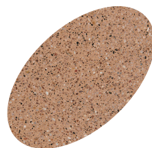
L23 - 330