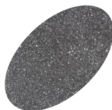
L04 - 330