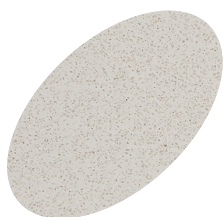
L01QZ - 330