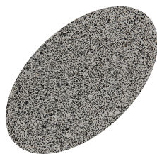
L35 - 330