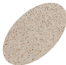
L16 - 330