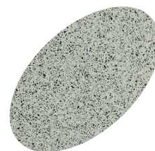
L32 - 330