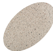
L24 - 330