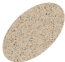
L07 - 330