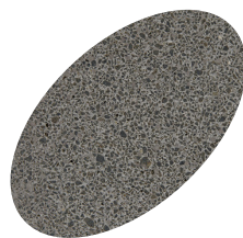
L36 - 330