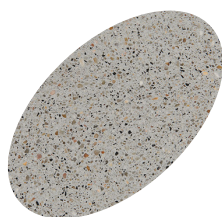
L03 - 330