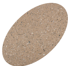
L26 - 330