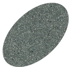
L33 - 330