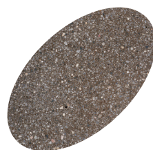
L05 - 330