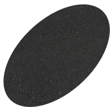
L34 - 330