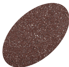
L27 - 330