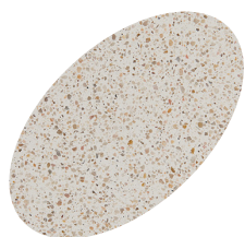
L01 - 330