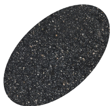
L08 - 330