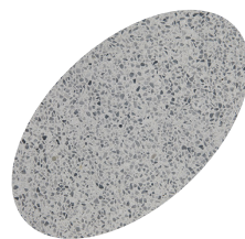
L39 - 330